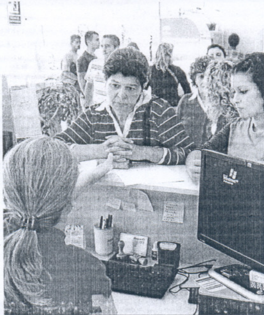
Dos mujeres reciben información en una oficina del SAE.

La causa de este gran incremento ha sido, fundamentalmente, que el Gobierno extendió del 1 de agosto de 2009 al 1 de enero de 2010 el periodo retroactivo para acogerse a esta asignación, que tiene una cuantía fija de 426 euros y una duración de seis meses. Es decir, los desempleados que han podido solicitarla en este tiempo son aquellos que han agotado la prestación o, en su caso, la ayuda familiar durante todo 2009 o el pasado mes de enero, además de tener unas rentas totales inferiores a los 468 euros -cantidad equivalente al 75% del salario mínimo interprofesional actual- y comprometerse a entrar en un itinerario de inserción