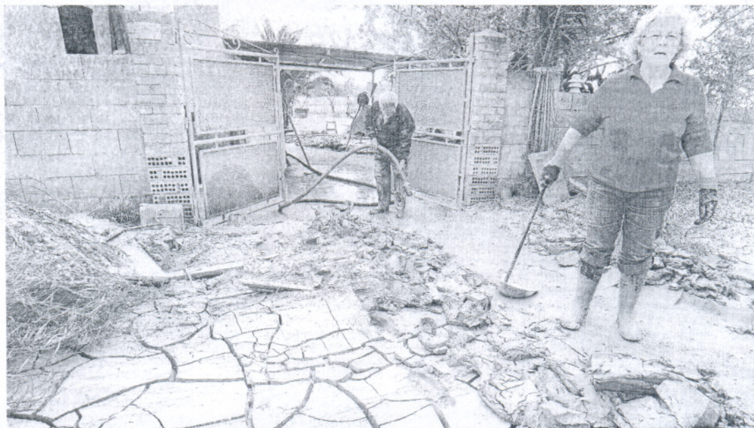
Vecinos de Las Pachecas pudieron ayer acceder al fin a sus viviendas para llevar a cabo las tareas de limpieza, tras muchas semanas fuera.

Los vecinos de las zonas afectadas por el temporal no se creen las promesas realizadas por la Junta hace un mes y asumen en solitario las tareas de limpieza