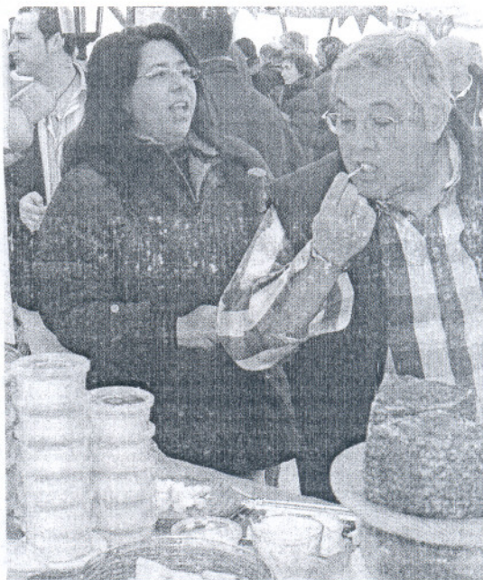
Un visitante prueba uno de los quesos durante la feria del año pasado.

El objetivo de esta feria es acercar al público en general los quesos artesanos y las múltiples posibilidades que ofrecen, mediante un mercado popular en el que queserías procedentes de casi toda Andalucía mostrarán sus productos, con la posibilidad de vender directamente al público que