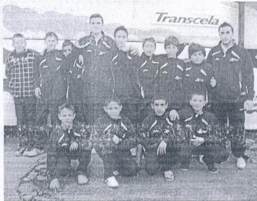
Foto de familia del combinado alevín de Cádiz, campeón de Andalucía.

Los benjamines ocupan la segunda posición y los prebenjamines acaban terceros en tierras malagueñas