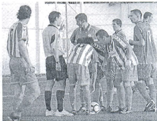
Un jugador del Sanluqueño se prepara para lanzar una falta.