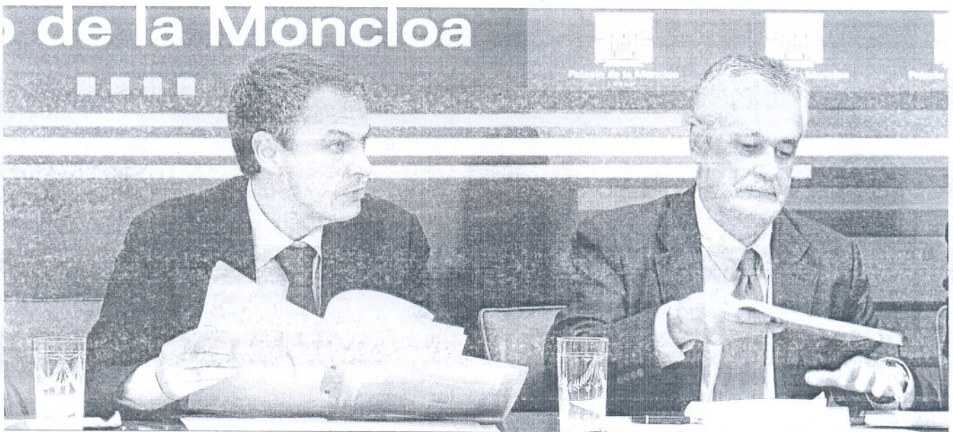
José Luis Rodríguez Zapatero y José Antonio Griñán, ayer durante la reunión entre el Gobierno y la Junta.