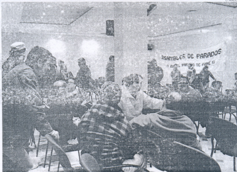
Los partidos de la oposición centran su reclamación en la permisividad dada en otros momentos a otros colectivos.

Desde el Partido Socialista dicen no entender que el equipo de Gobierno y su alcalde hayan permitido que algunos colectivos hayan permanecido más de cinco