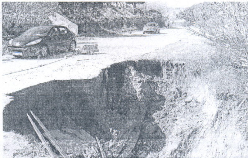
La avenida de la antigua vía férrea de La Jara se vino abajo días atrás en este punto situado junto a Las Piletas.