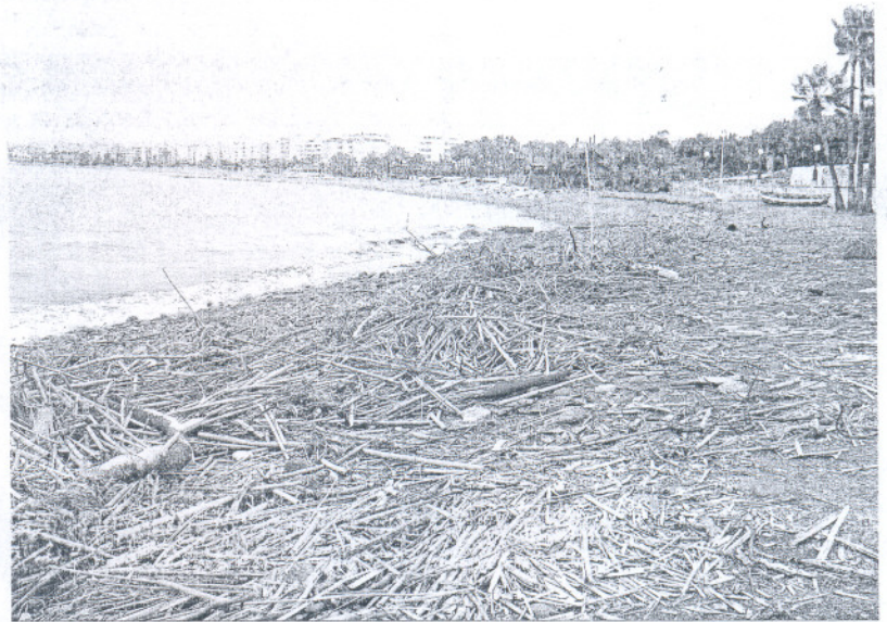
Playa de Estepona, devastada por el temporal.

También ha puesto el énfasis la Cámara en su petición de agilizar "de forma urgente y efectiva" otras medidas que el Gobierno pueda pactar con las comunidades afectadas -como ocurrió ayer mismo en La Moncloa- y solicitar los recur-