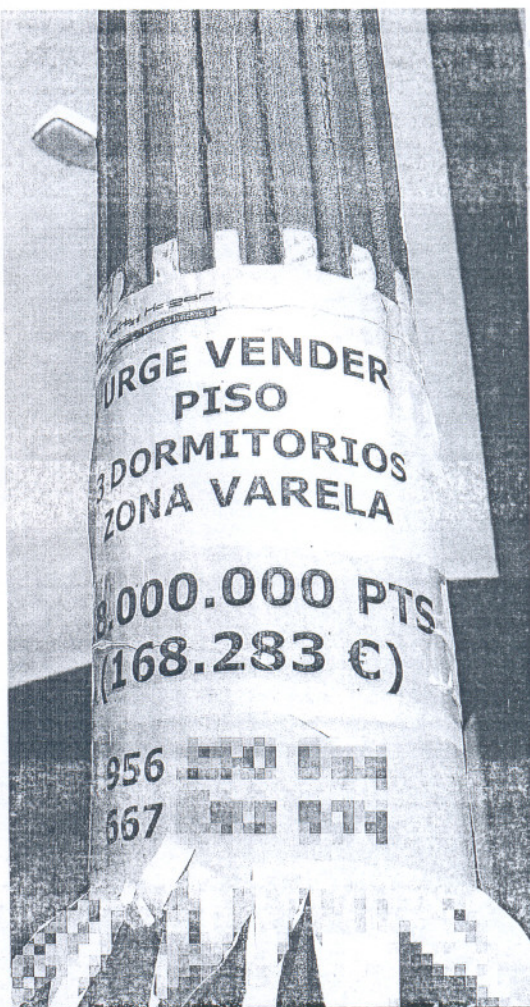
Un cartel anuncia la venta de un piso en Cádiz.

El Ministerio de Vivienda ofrece datos sobre este tipo de transacciones desde el año 2004. La diferencia es significativa. Entonces se realizaron en la provincia de Cádiz un total de 21.064 operaciones,