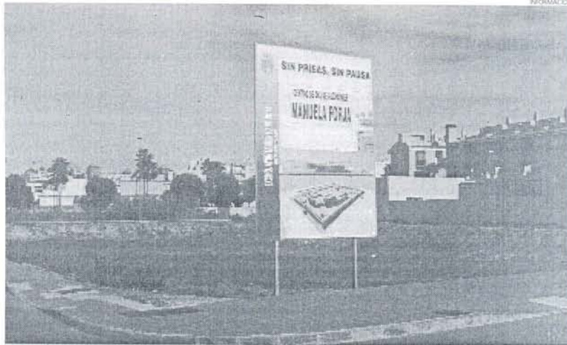
El partido UPyD aportó esta foto reciente del solar, aún sin tocar, del futuro centro de alzheimer 'Manuela Forja'.

Como ejemplo, desde UPyD se refieren al centro de Día Manue-