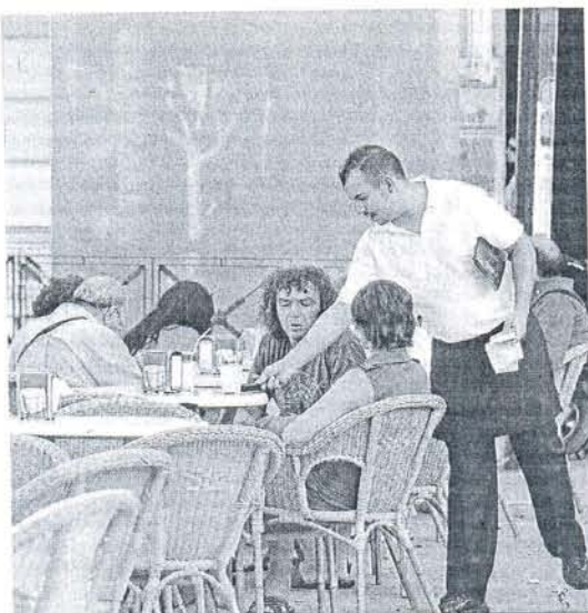
Un camarero atiende a la clientela en una terraza de Jerez.