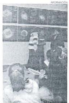
Visita a la exposición.

Esta exposición ofrece a los visitantes el Universo mediante una colección de más de cuarenta imágenes astronómicas de gran relevancia científica divulgativa, pero además de una belleza increíble, tomadas desde diferentes observatorios del mundo, incluida Andalucía. Todas las personas que deseen disfrutar de esta exposición, de la mano de la Diputación de Cádiz dentro del programa de Cooperación Cultural, podrán visitarla de nueve de la mañana a dos de la tarde y de siete de la tarde a nueve de la noche. La muestra está organizada por la Fundación DESCUBRE, cuenta con el patrocinio de la Consejería de Economía, Innovación y Ciencia, y está promovida por el Centro Astronómico Hispano Alemán, A.I.E. (Observatorio de Calar Alto), Real Instituto y Observatorio de la Armada.