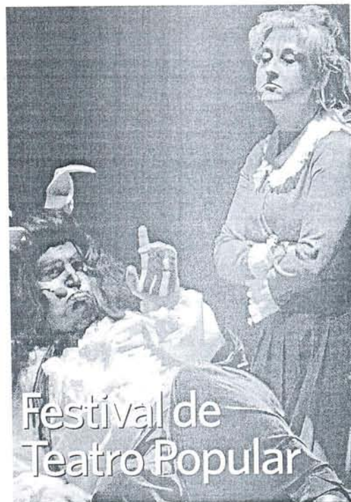
Montaje de 'La Bella y la Bestia' de la compañía Teatro Eslava.