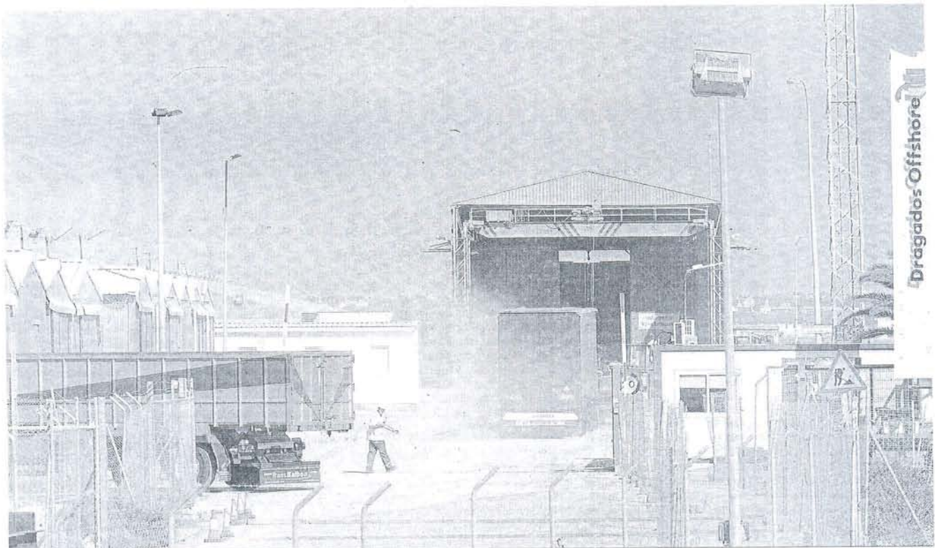
Imagen del interior de la factoría de Dragados Offshore en Puerto Real, donde ayer se trabajaba en los distintos proyectos.