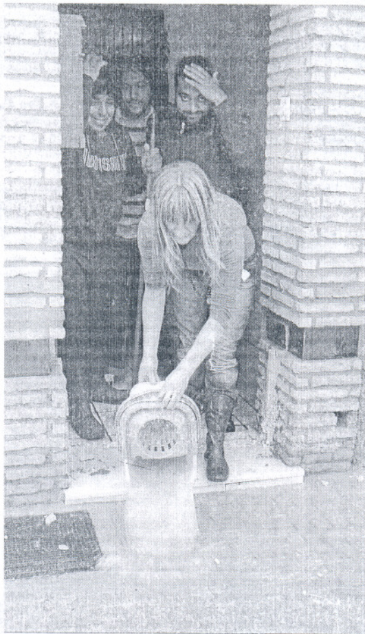
Una de las muchas afectadas por el pasado temporal en Chiclana. PACO PERIÑÁN

Al respecto, Loaiza afirmó que la "ineficacia" del PSOE en todos sus compromisos hace que, hoy por hoy, no hayan llegado las subvenciones prometidas tras las primeras inundaciones de diciembre "y mucho menos las de febrero", al tiempo que criticó que "tampoco han empezado a trabajar las anunciadas cuadrillas de limpieza en la zona rural de Jerez, siguen estudiándose las soluciones al estado de las playas o se mantengan cortadas una decena de carreteras en la provincia después de un mes de las últimas precipitaciones y de que máximos responsables del Gobierno y la Junta anunciaran