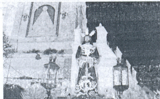
Imagen del Cautivo, en una procesión de años anteriores.

La cofradía del Cautivo es la más joven de las que conforman la Semana Santa de Medina. En el año 2003 le fue concedido el título de hermandad. Procesiona un único paso, que fue estrenado además durante la procesión de la Semana de Pasión del pasado año.