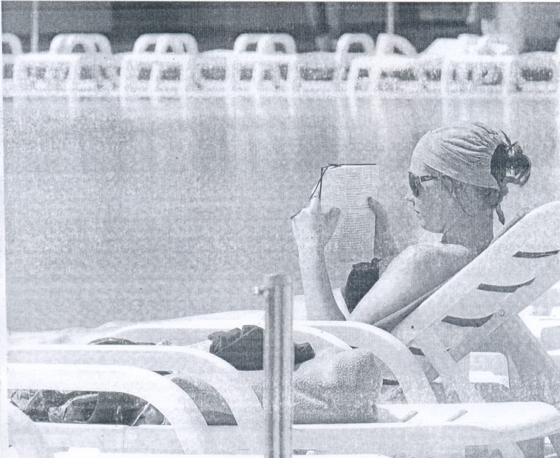
Una turista lee y toma el sol junto a la piscina de un hotel de Chiclana, ayer domingo.

DINERO Los analistas del sector creen que la Semana Santa se cerrará con los mismos visitantes, pero que éstos gustarán menos