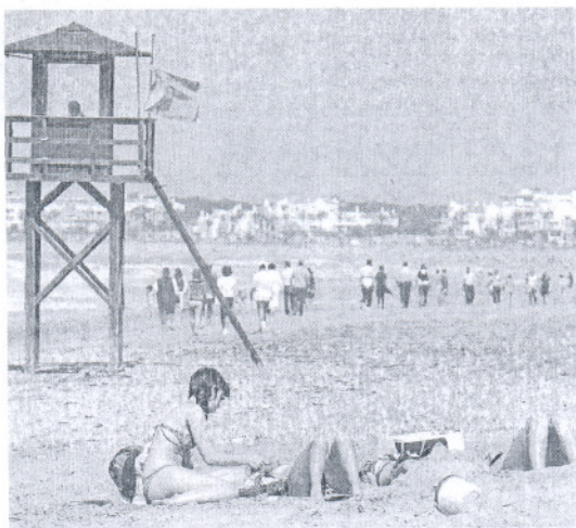
Las playas de la provincia notaron el inicio de las vacaciones. SONIA RAMOS

En el camping de Caños de Meca, uno de los mejores de la pro-