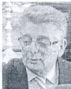
Francisco González Cabaña.

Esta iniciativa de la Diputación Provincial de Cádiz pretende ofrecer mano de obra a los parados de los 44 municipios gaditanos, vinculando el empleo a la necesaria solución a los daños ocasionados por el temporal. El presidente de Diputación, Francisco González Cabaña, ha explicado que "los Ayuntamientos serán los encargados de contratar al personal con carácter inmediato. Este programa se concibió antes del temporal, pero creo que tenemos la oportunidad de sumar estos recursos a los trabajos de reparación que necesitan tantos municipios gaditanos". González Cabaña apuntó además que "las políticas de empleo mantienen su pujanza