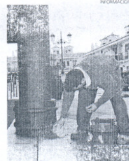
La plaza luce mejor aspecto.

que transitan por esta zona. Así, se han instalado 40 metros lineales de piedra artificial y se ha invertido un presupuesto aproximado de 1.000 euros para todo el adecentamiento.