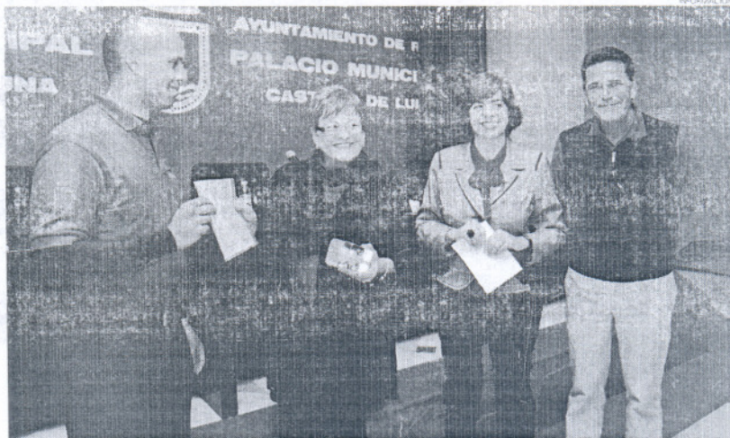
La Oficina Municipal de Turismo del Consistorio ha sido premiada con este reconocimiento del touroperador.

Esta agencia de golf sueca 'Incoming Costa de la Luz', a través de unas encuestas realizadas a sus clientes y a su personal de atención a público, ha comenzado en este año pasado año 2009 a conceder unos premios denominados 'Best Choice 2009' a diferentes establecimientos en la provincia de Cádiz que han destacado durante todo el año por ofrecer el mejor servicio, relación calidad-precio y disposición a los cambios.