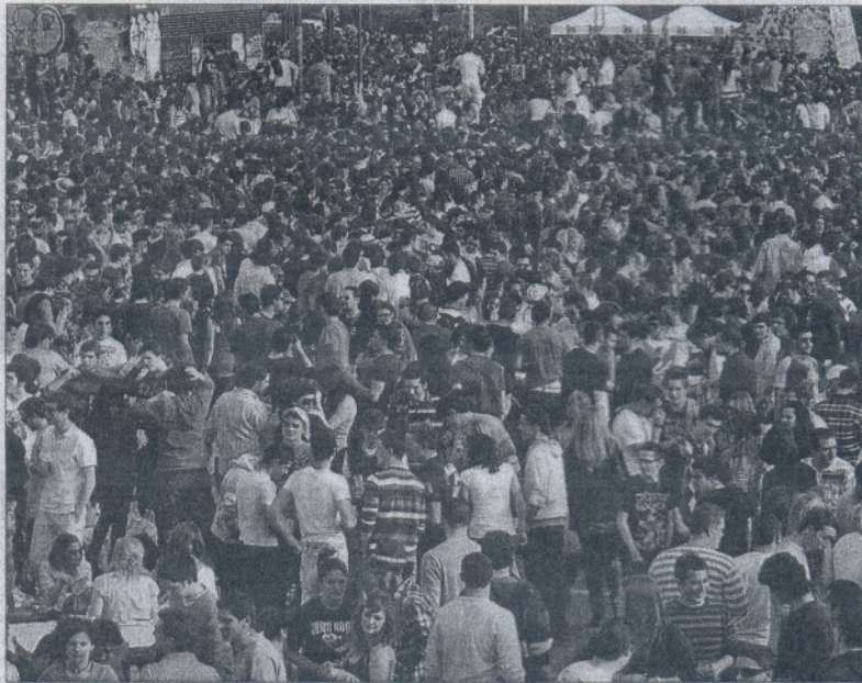
Cientos de jóvenes celebran el pasado marzo la llegada de la primavera con un botellón en Granada.

La contaminación acústica es el principal problema ambiental que identifican los ciudada-