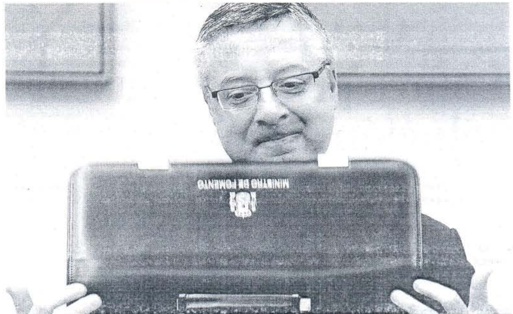
El ministro abre su cartera, ayer momentos antes de su comparecencia en la comisión de Fomento del Congreso.