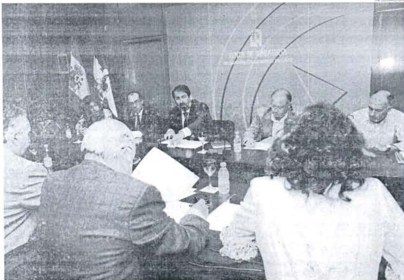
Imagen de la Comisión de Seguimiento de los proyectos que tuvo lugar ayer por la mañana.