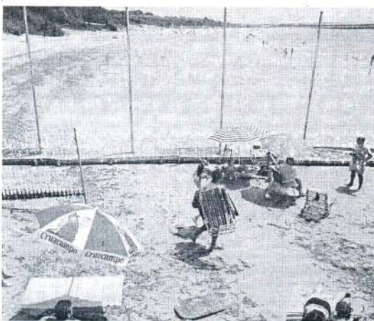
Límite de la playa del Chorrillo con la del Almirante, el año pasado.

Además, numerosos roteños y turistas se han interesado y han preguntado en las distintas oficinas municipales sobre los trámites necesarios para poder acceder