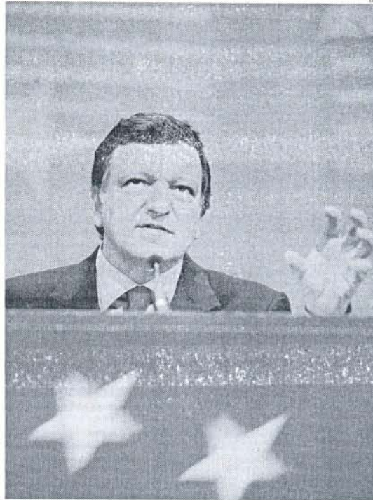
El presidente de la Comisión Europea, Durao Barroso.

El informe mensual de la CE alerta, en este sentido, de que a pesar de que está en marcha la re-