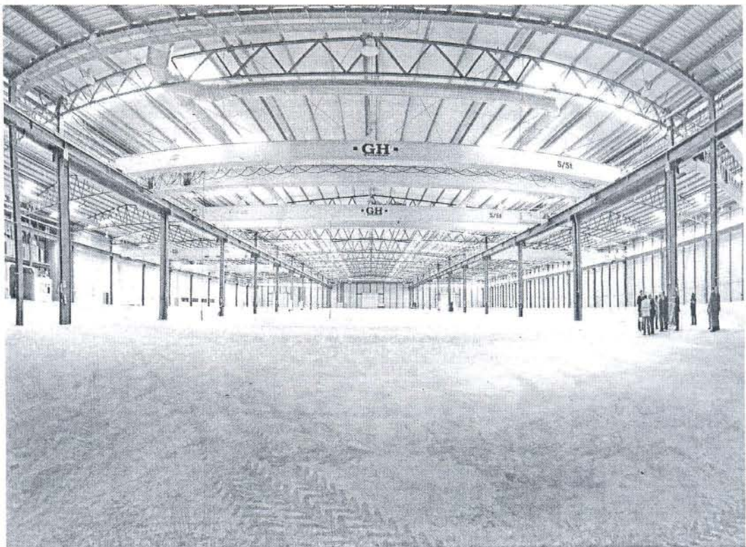
Vista del interior de la nueva factoría de Alestis, ubicada en la zona donde estaba Delphi en Puerto Real.