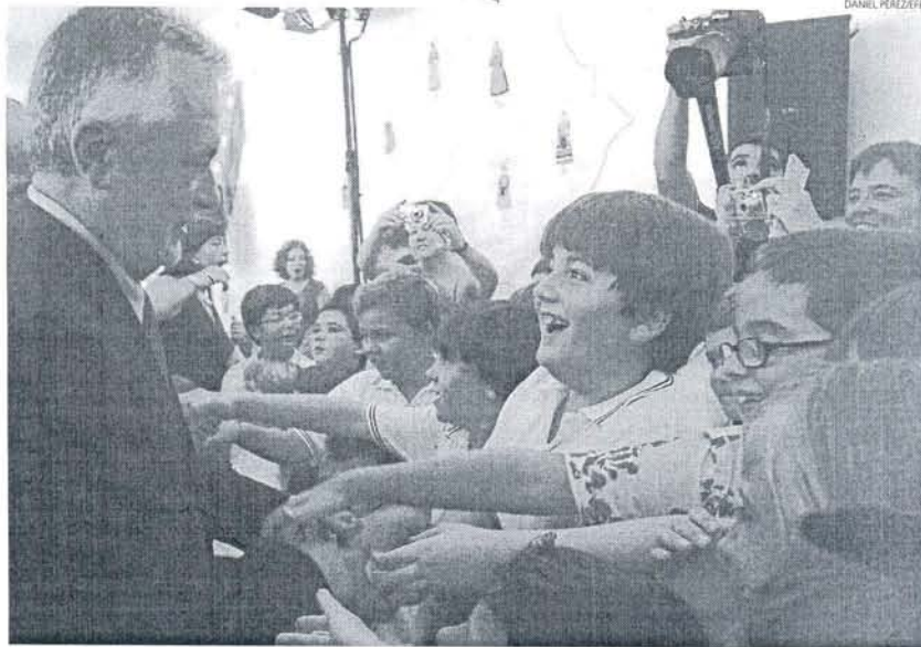
El presidente de la Junta, José Antonio Griñán, conversa con algunos alumnos durante la inauguración del curso.