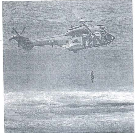
El helicóptero SAR inicia su maniobra de rescate.

Asimismo, resaltaron el "enorme despliegue" que supone la organización de este evento, que, entre otras, incluye tareas de se-