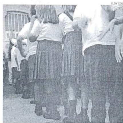
Los uniformes ya se dejaron ver en el día de ayer.