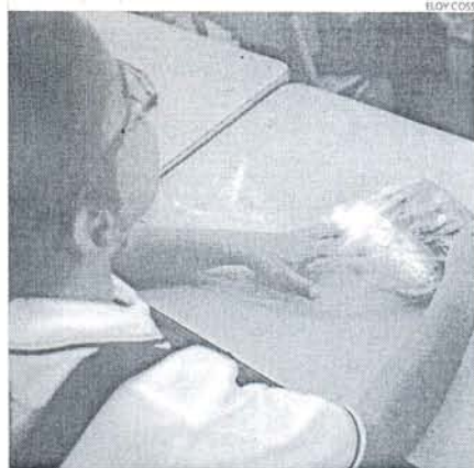
El desayuno no faltó el primer día de clases.