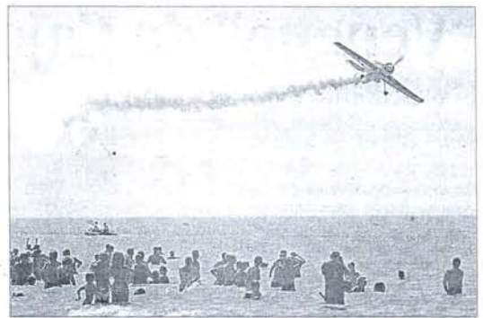
Un piloto realiza una acrobacia en la playa de la Victoria / ROMÁN RÍOS

Según Educación, la actual tasa de interinidad del 5,2% es la más baja de la historia en Andalucía. Además, hace que la comunidad entre dentro de las recomendaciones de la UE, que fija un techo del 8%.