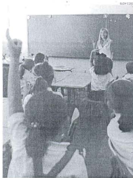
El primer día fue de presentaciones y adaptación.