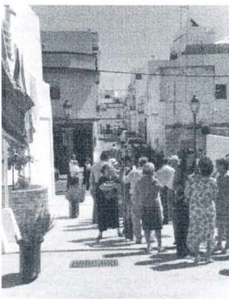
En el paso de la nueva calle inaugurada el viernes

Tras más de 25 años, la calle Pozo El Cano ha pasado a ser de dominio público y abierta al paso de peatones con una remodelación integral que permitirá que los vecinos de las calles Calvario y Calderón de la Barca estén comunicados por esta vía que en la mañana del viernes se inauguraba.