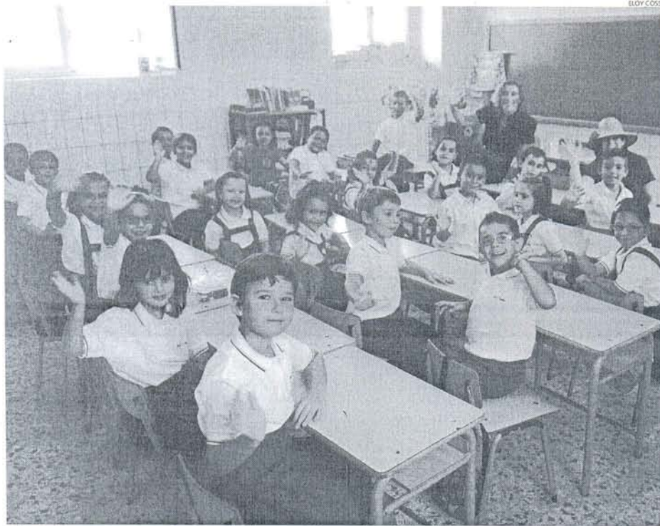
Miles de niños comenzaron ayer las clases, siendo para muchos su primer día de colegio.

EDUCACIÓN Los alumnos de ESO y Bachillerato comenzarán el curso el próximo 15 de septiembre