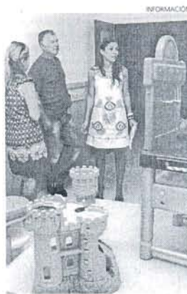
Los centros estaban a punto.

de julio, se ha estado trabajando en los colegios para llevar a cabo estas obras de reforma y mantenimiento que hacen posible una puesta a punto de estos edificios, que año tras año sufren un importante desgaste.