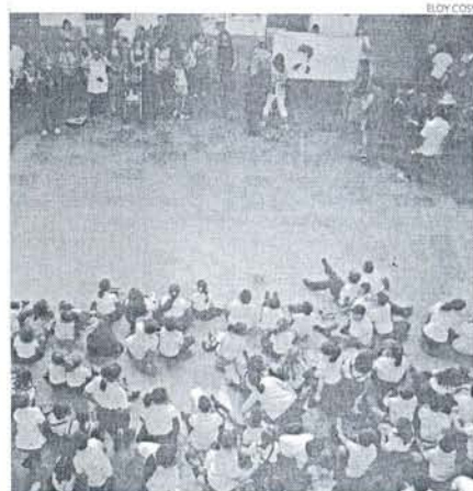
Algunos centros optaron por un recibimiento conjunto.