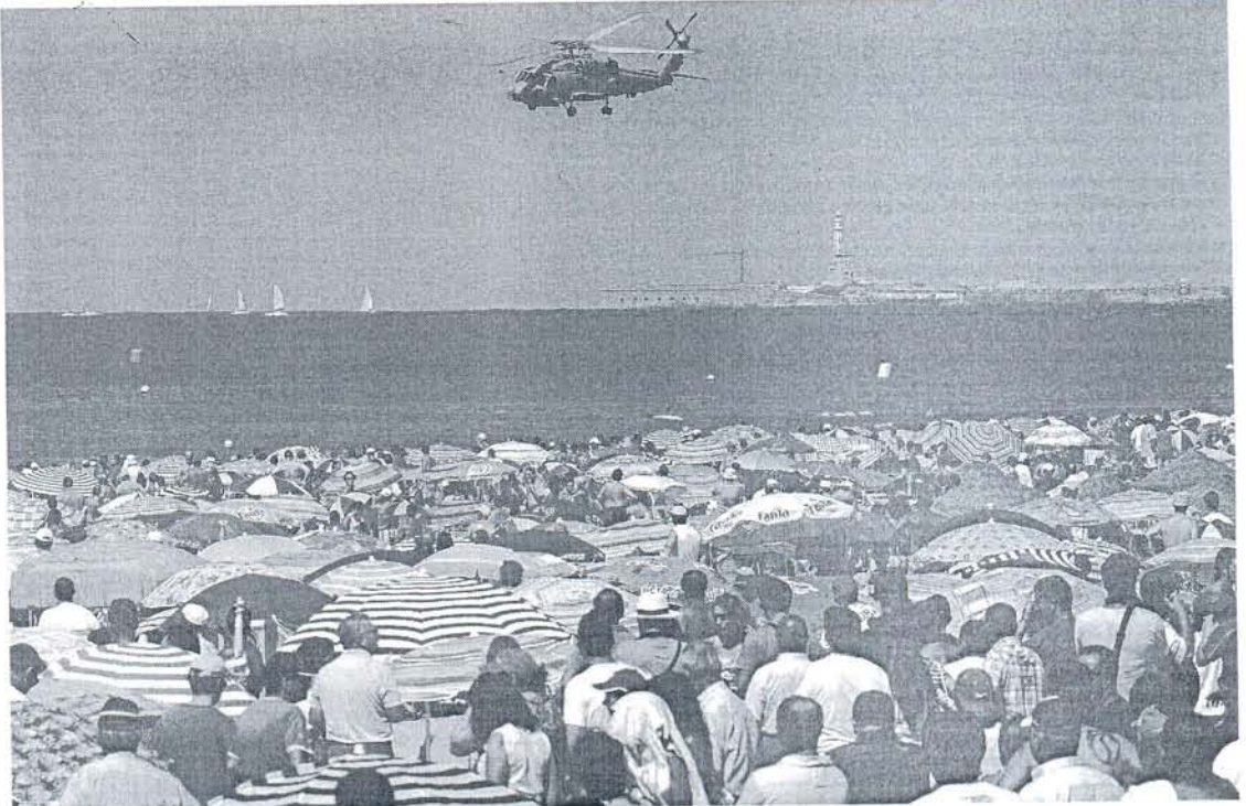
El helicóptero Lamps organiza su exhibición con la Playa Victoria abarrotada.