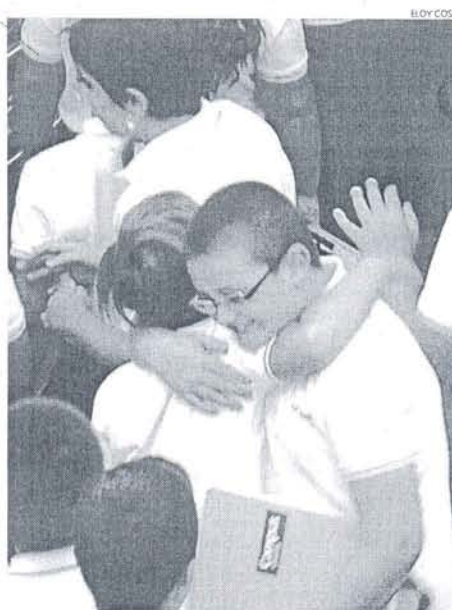
Muchos mostraron su alegría al reencontrarse con los amigos.