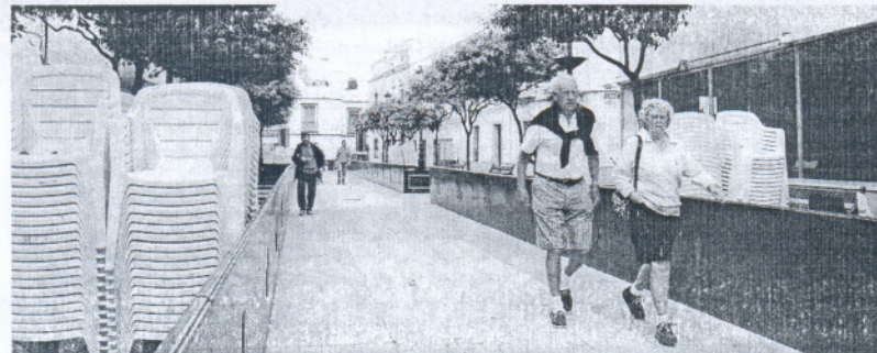
Preparativos en la carrera oficial, en la Plaza Barroso de Rota.

La única hermandad del Domingo de Ramos de Rota, que