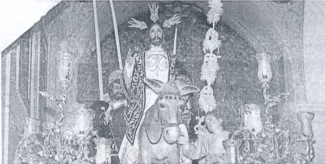
El paso de misterio de La Borriquita, preparado ya para su salida de hoy en San Diego.