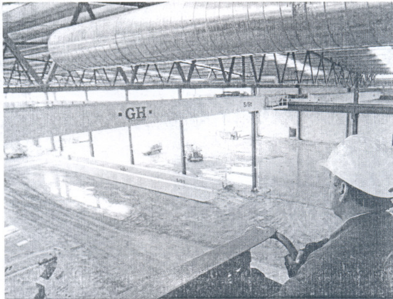
Imagen de las obras de construcción de la fábrica de Alestis, donde ya hay contratados.

Del resto, 340 personas (con 51 y 52 años cumplidos), hay 15 que ya han dicho que no se irán, que continúan en el proceso acordado entre sindicatos y Junta. Esto puede deberse a varios motivos: por que su categoría laboral en Delphi era elevada (ingenieros, etc.) y