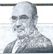
Jesús Candil Director general del Ministerio de Industria

Hay un compromiso firme y rotundo por parte del Gobierno de seguir apoyando a la provincia con este plan hasta 2013"