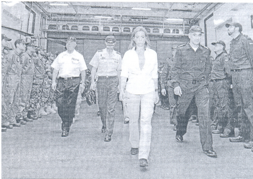
La ministra de Defensa es recibida por la dotación del 'Castilla' a su llegada al navío fondeado en Haití.

Recordó que en estos meses en Haití han participado unos