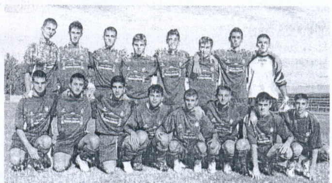
Décimo triunfo del San Marcos juvenil (en la foto), esta vez venciendo a El Colorado.