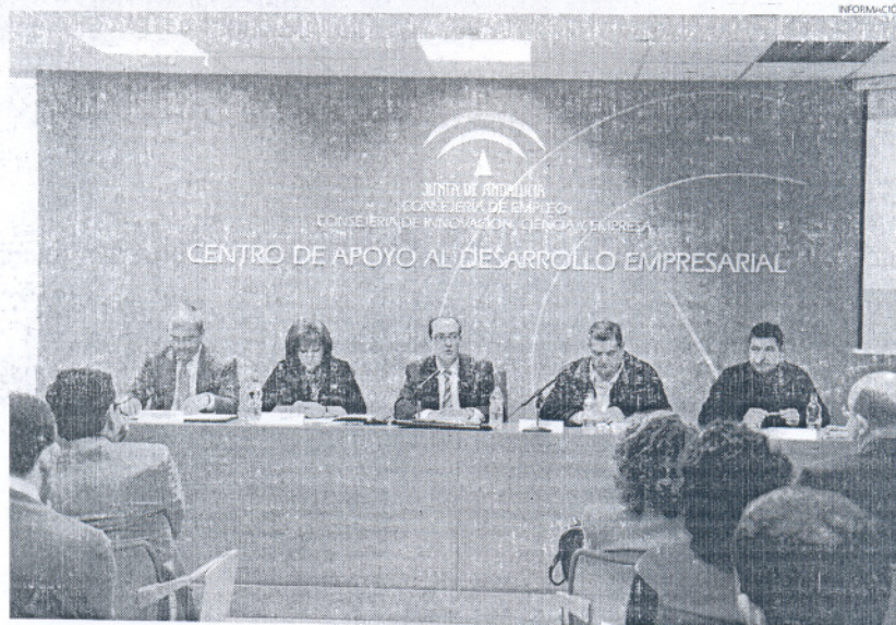
El nuevo Plan de Actuaciones 2010 fue presentado ayer en el Centro de Apoyo al Desarrollo Empresarial.

Algunas de las actuaciones más destacadas estarán centradas en