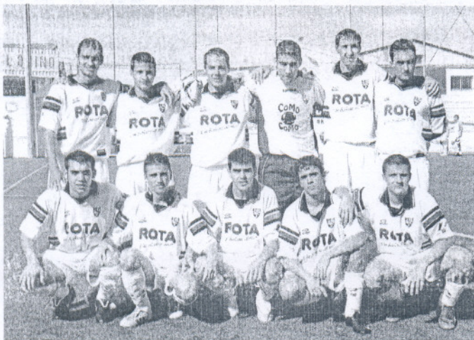
La Roteña juvenil se quedó sin puntuar en El Puerto.