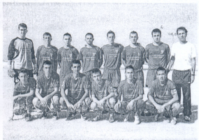
Los juveniles del Trebuena no fallaron en un duelo muy importante.