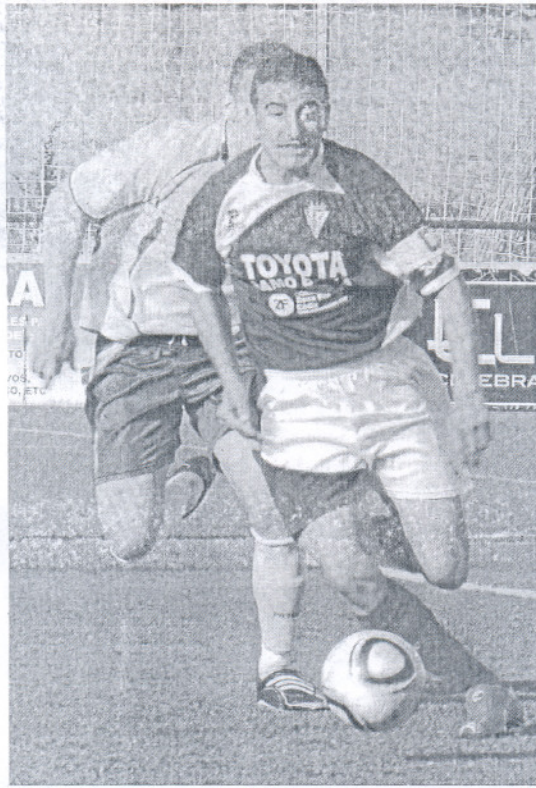
Puli trata de marcharse en velocidad del marcaje de un linense.

En quince segundos, un error defensivo se unía al acierto del máximo goleador azulino que no perdonaba en un mano a mano