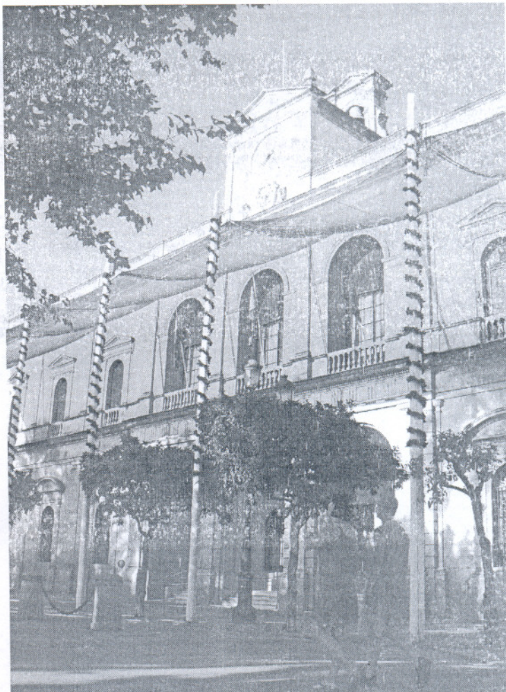
El Ayuntamiento de Sevilla, por ejemplo, perdería 45 millones con la enmienda del PP, según el PSOE.

Y todo no se queda en las enmiendas. Ahora lo que se ha iniciado es la lucha de las mociones y las cartas, estrategia común en los partidos de la oposición.