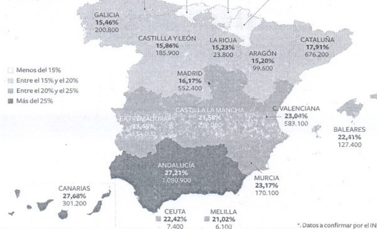
Tasa de paro (en % de la población activa) y número de parados