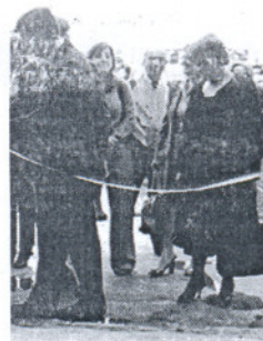
Le editor roteño (l) acudió al Salón.

Para el partido, ambos casos son una muestra clara de "falta de respeto a los usuarios", y estas situaciones ofrecen además "una mala imagen de un municipio turístico como es la localidad", por lo cual piden al Pleno que inste al Consorcio para que ponga soluciones a ambas situaciones mencionadas.