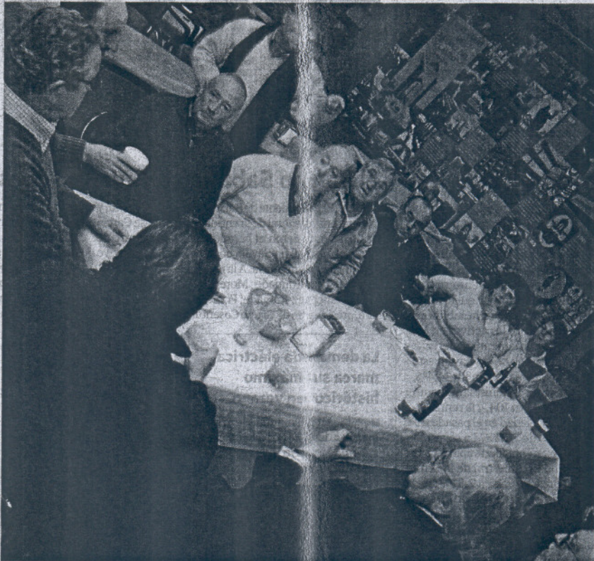
Jubilados de la Asociación Gambrinus, en Sevilla.

Estos "planes de ajuste a largo plazo" deberían basarse en las actuales tendencias de envejecimiento