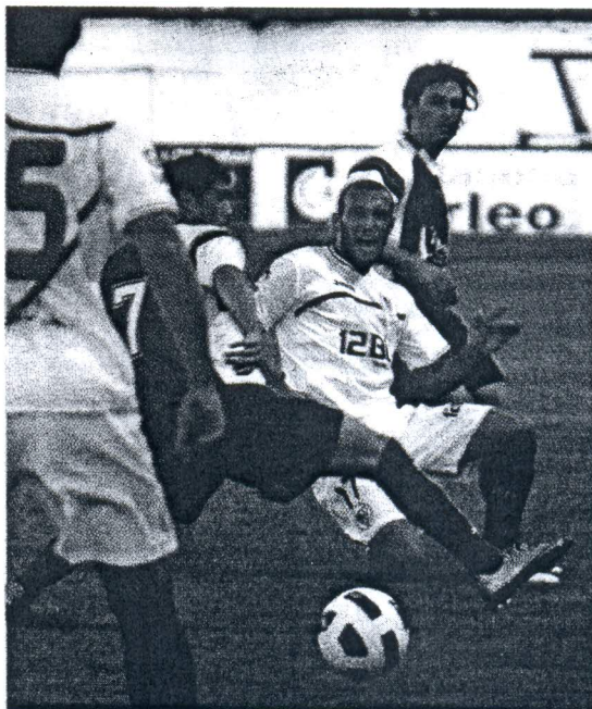
Un lance del partido jugado ayer entre el Chiclana y el Sevilla.