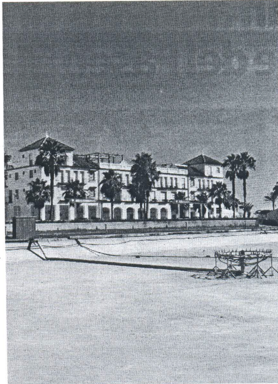
La solución final tendrán que encontrarla los municipios en los Juzgados.

Según explicó el Consejo Consultivo en un comunicado, el conflicto entre los dos municipios gaditanos limítrofes tiene su origen en septiembre de 2007, cuando el Pleno del Ayuntamiento chipionero decidió crear una comi-