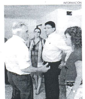
El casino será remodelado del todo.

en la planta baja, se instalará protección contra incendios y climatización, se adaptará la planta primera como salón multiusos, se creará un aula de informática y se adquirirá nuevo mobiliario para esta entidad social.