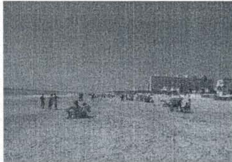
Imagen de la playa a la hora del incidente.

Un bañista ha fallecido en la tarde de hoy jueves mientras se bañaba en la playa de la Costilla, a la altura de la zona conocida como Santa Marta. Los hechos han ocurrido en torno a las tres de la tarde cuando el bañista comenzó a pedir ayuda desde dentro del agua. Al oír los gritos de socorro, dos personas fueron a socorrerlo y lograron llevarlo hasta la orilla. Fue entonces cuando llegaron los servicios de emergencia. Protección Civil, Policía Local y Policía Nacional. A pesar de los intentos de reanimar al bañista, los médicos no pudieron hacer nada por su vida y el hombre falleció en la misma orilla de la playa. Según testigos presenciales, el fallecido llevaba un buen rato pidiendo auxilio por lo que se baraja la posibilidad de que se sintiera mal durante el baño.