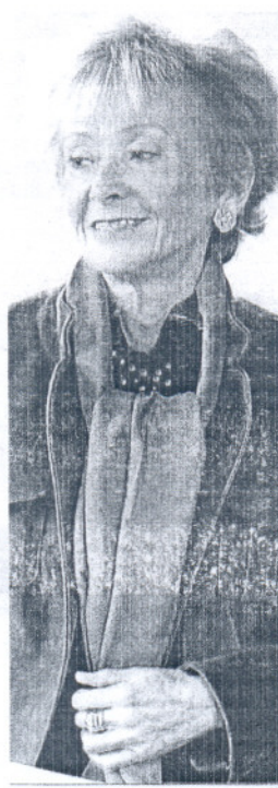
De la Vega, ayer en La Moncloa.

La vicepresidenta primera del Gobierno, María Teresa Fernández de la Vega, negó que el Monarca haya iniciado una "ronda de contactos" concretos con par-