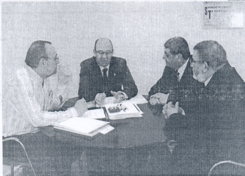
Los representantes de Playas y Medio Ambiente del Consistorio rotoño solicitaron el trámite ante el SAS.

Por este documento, el Ayuntamiento pretende que se modifique el censo de aguas de baño