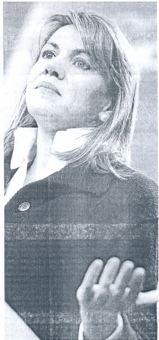
María Dolores de Cospedal, en rueda de prensa.

Fuentes de la dirección nacional del PP recordaron a Europa Press que el Rey ya apeló en su tradicional mensaje navideño a la unidad de las fuerzas políticas para afrontar la crisis económica, un llamamiento al que respondió una semana después el presidente del Gobierno, José Luis Rodríguez Zapatero, alegando que las diferencias "ideológicas" con Mariano Rajoy dificultaban ese acuerdo.