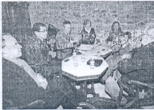
Encuentro del Foro de Turismo, ayer, en el Castillo de Luna, en Rota.