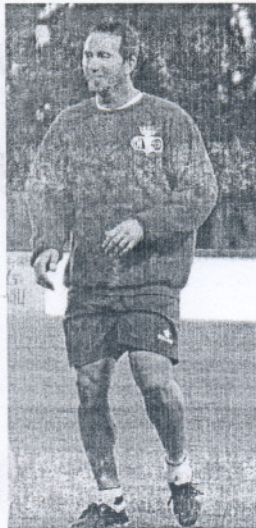
Flores, novedad blanca.

Pese al potencial que pueda tener el Pastores, Bolli es consciente de lo importante que es sumar los