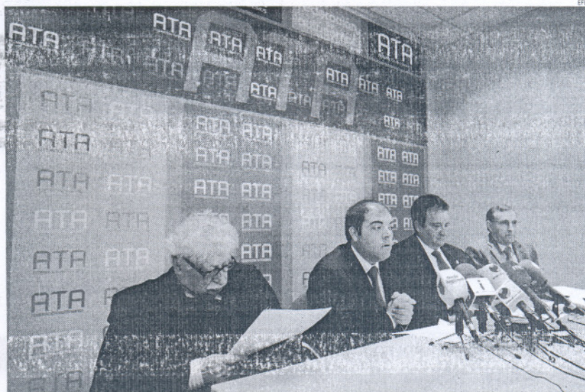
Los trabajadores autónomos ven "adecuada" la reforma de la Ley de Morosidad.

La iniciativa, que fue presentada por CiU y ha sido aprobada por unanimidad en gran parte de su