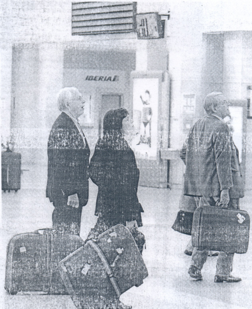
Pasajeros en la terminal jerezana, en una imagen de archivo.

Durante los próximos meses, la terminal mantendrá sus vuelos regulares diarios a Madrid, fletados por Iberia y Ryanair, Barcelona (Vueling) y Palma de Mallorca (Air Berlin). Además, fuentes de la línea regional de Iberia Air Nostrum