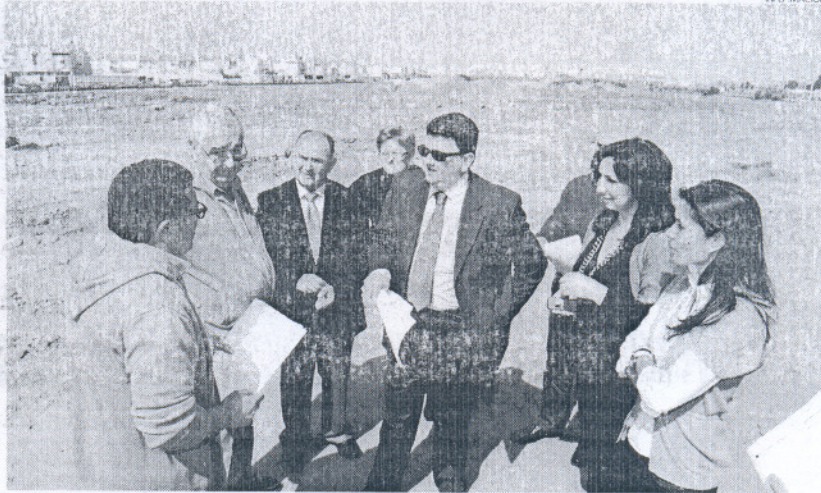
El alcalde ha visitado esta nueva zona verde que cambiará la fisonomía de las nuevas áreas urbanizadas.

marcha, se realiza la obra civil para definir las distintas zonas que se podrán encontrar en este parque, incluyendo trabajos de desbroce y limpieza, la definición de viales internos y caminos, la construcción de la red de alumbrado público, así como la de abastecimiento, o la de baja tensión; o la reserva de camaleones.