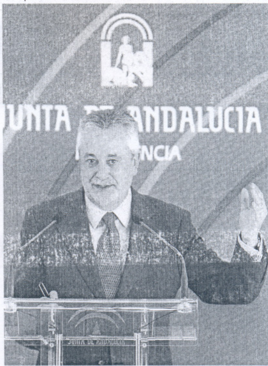
José Antonio Griñán, ayer, tras el Consejo de Gobierno.

No es la "austeridad" tantas veces demandada por la oposición la que está detrás de esta decisión del presidente andaluz, José Antonio Griñán. El gasto de los altos cargos apenas alcanza 17 millones en un presupuesto con cifras mil millones. La razón está en la búsqueda de Griñán de la "organización adecuada" para los fines que persigue. Acaba de perfilar su segundo equipo de Gobierno —el tercero en lo que va de legislatura—, y se su-