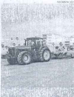
La maquinaria de Costas trabajará.

agradecido a la Demarcación de Costas la realización de los trabajos que se centran en alisar la arena de la playa. Con todo, estos trabajos se tendrán que completar de cara al verano.