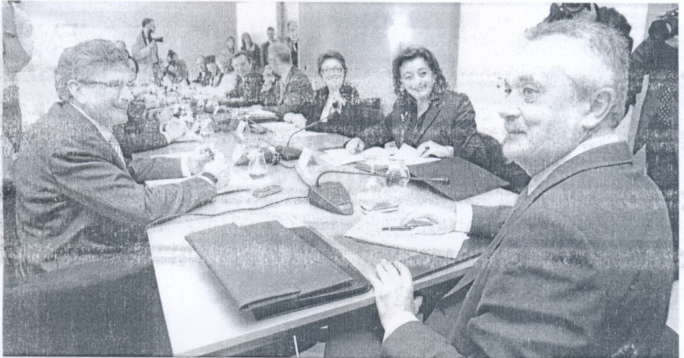
José Antonio Griñán, ayer, en el primer Consejo de Gobierno celebrado tras la toma de posesión de los nuevos consejeros de su Ejecutivo.