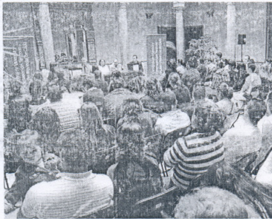
El sorteo de la Junta reunió a muchos interesados en el Palacio Municipal.

La delegada responsable del área aprovechó la ocasión, igualmente, para anunciar que "dentro de pocas semanas" se llevará a cabo el sorteo de las 90 nuevas viviendas de la barriada El Aimen-