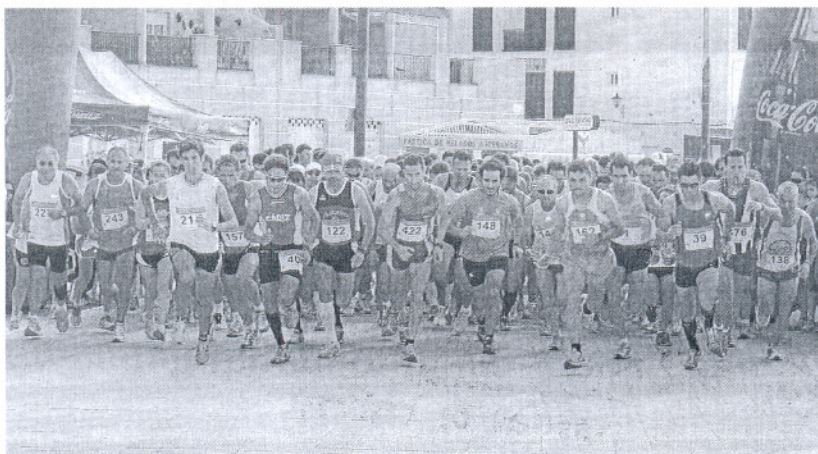
Momento de la salida para las categorías senior, veterano y junior promesa.

ATLETISMO • IV Carrera Popular Villa de Barbate