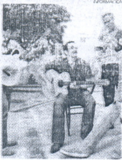
La Garret Wall Band.

quirir sus entradas al precio de tres euros en la taquilla del auditorio municipal en horario de seis a ocho de la tarde de lunes a viernes, y dos horas antes del espectáculo.