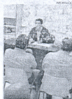
El edil del área presidió el consejo.

Asimismo, también se debatió sobre los daños provocados en los caminos del término municipal por parte de la empresa adjudicataria de las obras para la colocación de las tuberías de la estación EDAR de Costa Ballena.