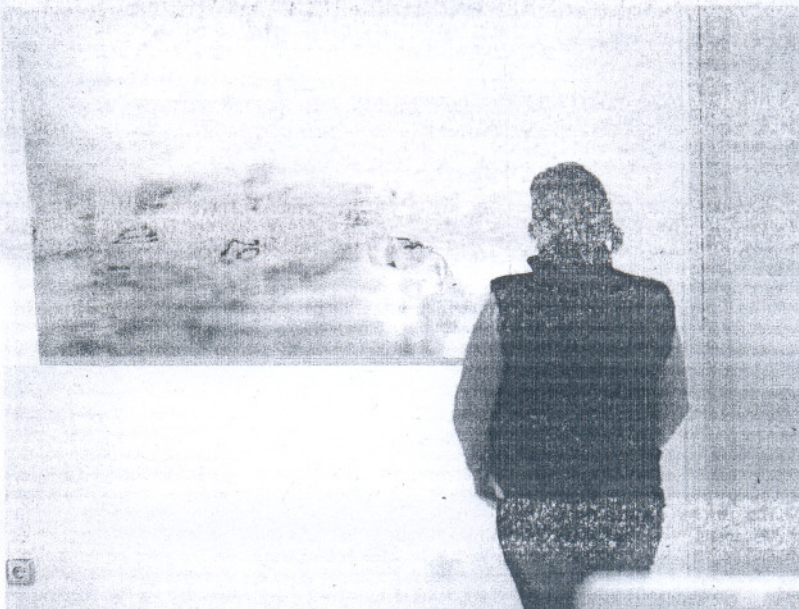
La muestra fotográfica podrá contemplarse en la Kursala hasta el próximo 28 de febrero.