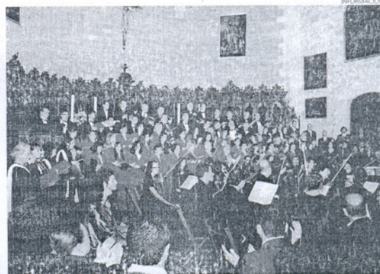
El Miserere volverá a ser interpretado en la Parroquia de la O.

Asimismo, ha informado que, además del Orfeón Virgen de la Escalera, en esta actuación musical participarán el Orfeón Portuense, la Coral Antares de Cádiz, además de una Orquesta gaditana de prestigio. Desde el Consistorio se ha animado a los ciudadanos a asistir a esta cita única.