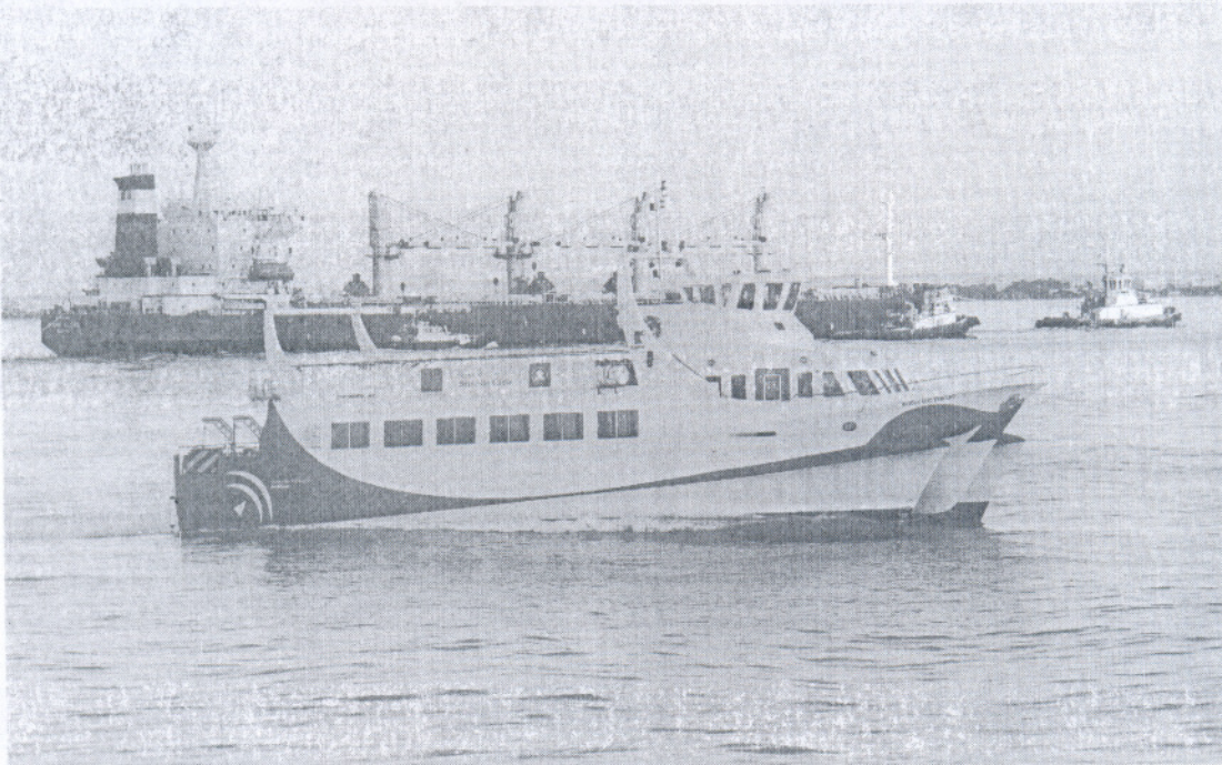
Trapsa es la empresa concesionaria del servicio de transporte marítimo de la Bahía de Cádiz.

Si Avanza termina de hacerse con la compañía, podría entrar en el Consorcio