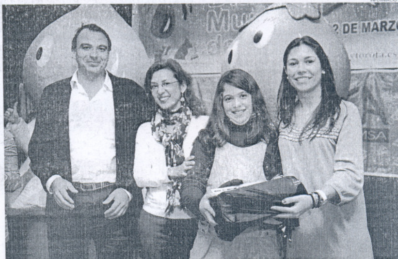
Los ediles de Participación Ciudadana, (i) y de Educación, así como el representante de Aqualia, entregaron los premios.

Prevía a la entrega de los premios, el Jurado del concurso, compuesto por representantes de la Asociación Base Natural y Cultural de Rota y la Asociación de Ecologistas en Acción de Rota, mantenían una reunión en la mañan