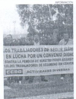
Algunos de los trabajadores.