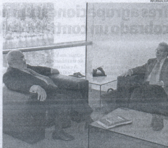
La reunión se produjo en la sede madrileña de APCE.

El Consejo Superior de Cámaras de Comercio, representante a nivel nacional e internacional de las 85 Cámaras de Comercio, es el interlocutor válido ante los órganos de la Administración del Estado, coordina las actuaciones de las Cámaras, fomenta la relación entre ellas y elabora la posición de las Cámaras de Comercio ante la Administración, a partir de información a empresas.