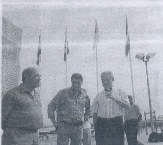
La jornada de galardones concluyó en las instalaciones de Chipiona.

vo del dique de abrigo de la zona pesquera" mediante una inversión de 80.000 euros y meses atrás acabó la primera fase de adecentamiento de la fachada de los locales comerciales por 230.000 euros.