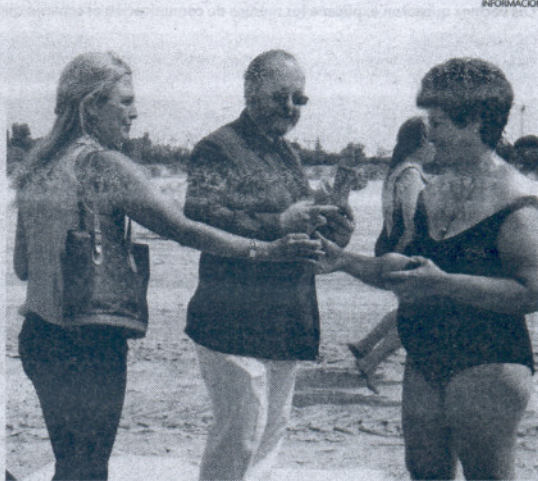
Los ediles reparten ceniceros entre los usuarios de las playas.

Los ediles también aprovecharon la visita a las playas para tomar contacto con los usuarios, pues son los que mejor pueden informar de cómo valoran los servicios que se ofrecen así como lo que consideran necesario, pero también para repartir ceniceros, además con la intención de concienciar a los ciudadanos de la necesidad de cooperar con el Ayuntamiento en lo que se refiere a las medidas de limpieza y cuidados preventivos, para poder hacer de las playas uno de los mejores atractivos.