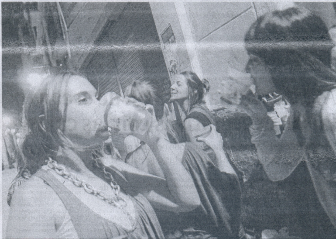
Unos jóvenes consumen bebidas en la salida de un local durante una noche en Málaga.

A estos efectos colaterales de la movida nocturna (intempestivas charlas y animadas aficiones fructuosa de la melopea, tubos de escape y demás) se refiere el Defensor en la resolución, a la que ha tenido acceso esta redacción, que ha remitido hace unas semanas a la Junta y de la que espera respuesta. Porque es la Administración autonómica y, en concreto la Consejería de Gobernación, la que tiene que hacer frente a esta "cruda realidad", considera Chamizo.