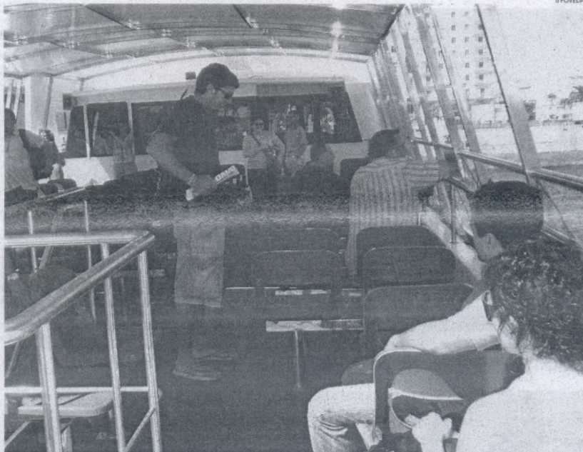
El Consorcio presta servicio a siete municipios de la Bahía.

Hace unos días el comité de empresa de Comes denunció los recortes que se han producido en el Consorcio, asegurando que las líneas M-10 y M-11 que unen Cádiz y San Fernando han aumentado su tiempo de frecuencia, pasando de los 20 minutos, a los 35. Además, criticaron el que se haya suprimido algunos servicios