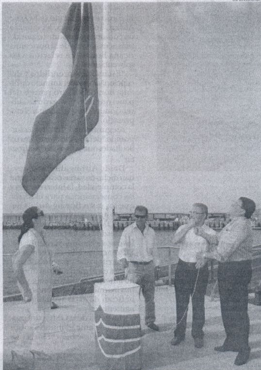
El alcalde de Rota y el delegado provincial izaron la Bandera Azul.

La concesión de la Bandera Azul al Puerto de Rota, que gestiona la Empresa Pública de Puertos de Andalucía (EPPA), garantiza la calidad de los servicios de este puerto, y acredita la sostenibilidad, accesibilidad y calidad de sus instalaciones y servicios que