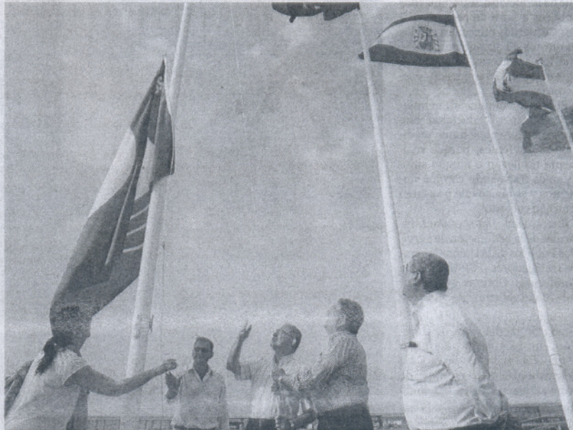
Un momento de la izada de la Bandera Azul de esta temporada estival en el puerto de Rota.

En el puerto de Chipiona, se están ejecutando varias obras, como la construcción de nuevos aseos por casi 410.000 euros. Asimismo, se ha llevado a cabo "el cerramiento nue-