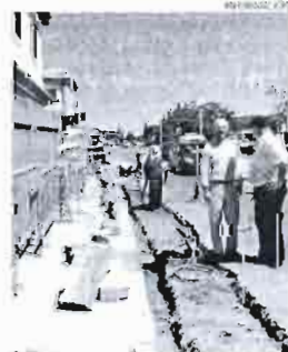
La calle contará con aparcamiento.

curando hacer desde el Ayuntamiento. "Nuestro objetivo es crear el mayor número posible de obras, al menor coste para aprovechar al máximo los recursos y generar empleo", ha indicado el edil de Servicios Municipales.