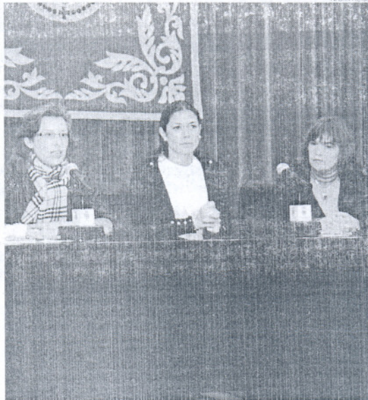
Las ediles han informado de estos talleres de apoyo a niños y familiares.