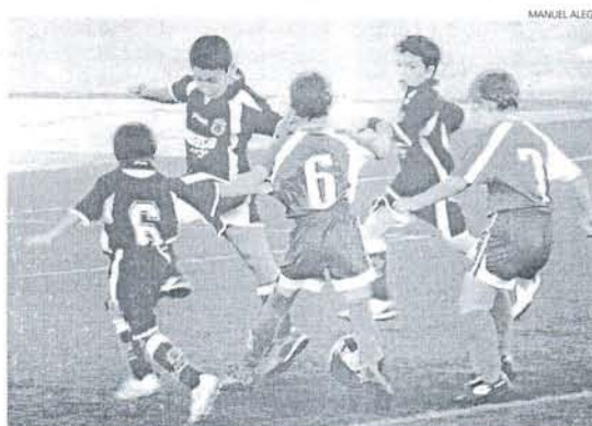
La Salle de Puerto Real, tercero del Grupo 2 de Primera, ganó en Chiclana.