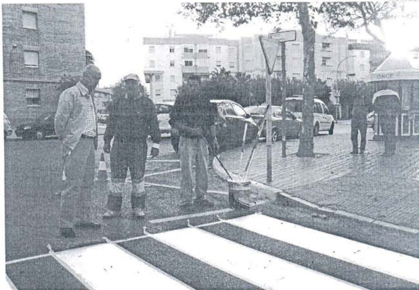
La delegación de Servicios Municipales ha habilitado treinta nuevos aparcamientos cerca del Mercado Norte.

El responsable municipal ha explicado que estas plazas se ubican en distintos puntos de la zona, por lo que están distribuidas por la citada avenida en localizaciones donde los espacios libres han permitido la creación de estos estacionamientos, que también se han conseguido al subir el aparcamiento de motocicletas a una am-