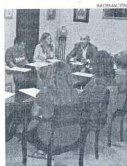
La reunión con los monitores.

marcó el encuentro en el que el delegado quiso trasladarles el compromiso porque estas actividades no sólo sean clases, sino también un punto de encuentro y de convivencia.