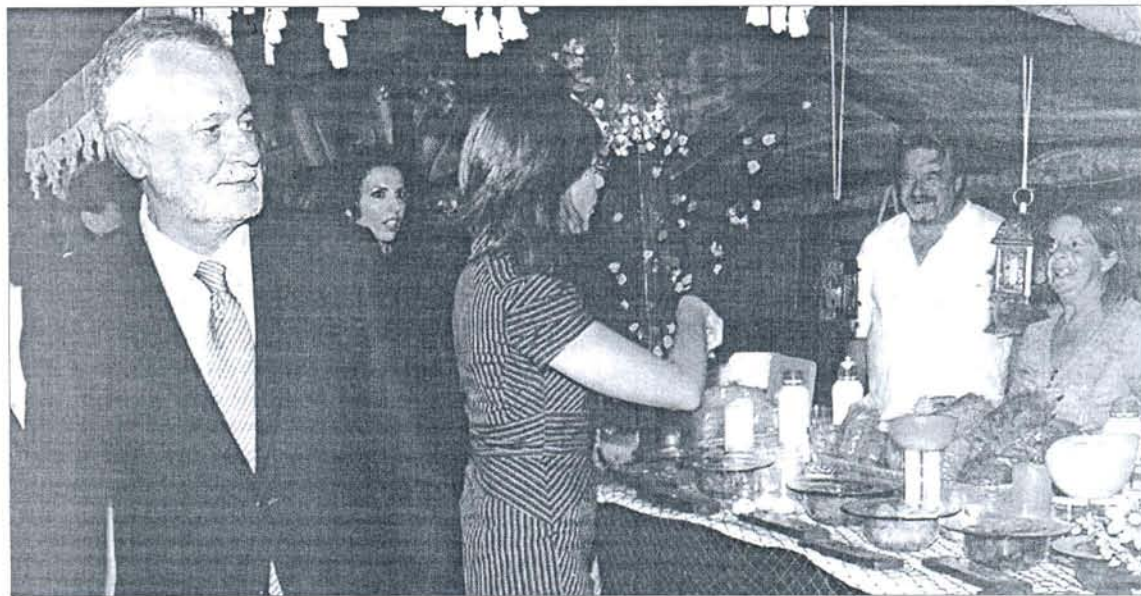
El presidente de la Junta, José Antonio Griñán, el pasado septiembre en el zoco de los artesanos del Festival de la Luna Mora de Guaro.

Griñán recorrió después el zoco de los artesanos, momento que recoge la fotografía que ilustra esta