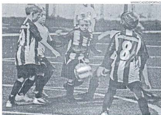
El Loreto se mantiene segundo tras ganar al Tiempo Libre en Elcano por 6-0.