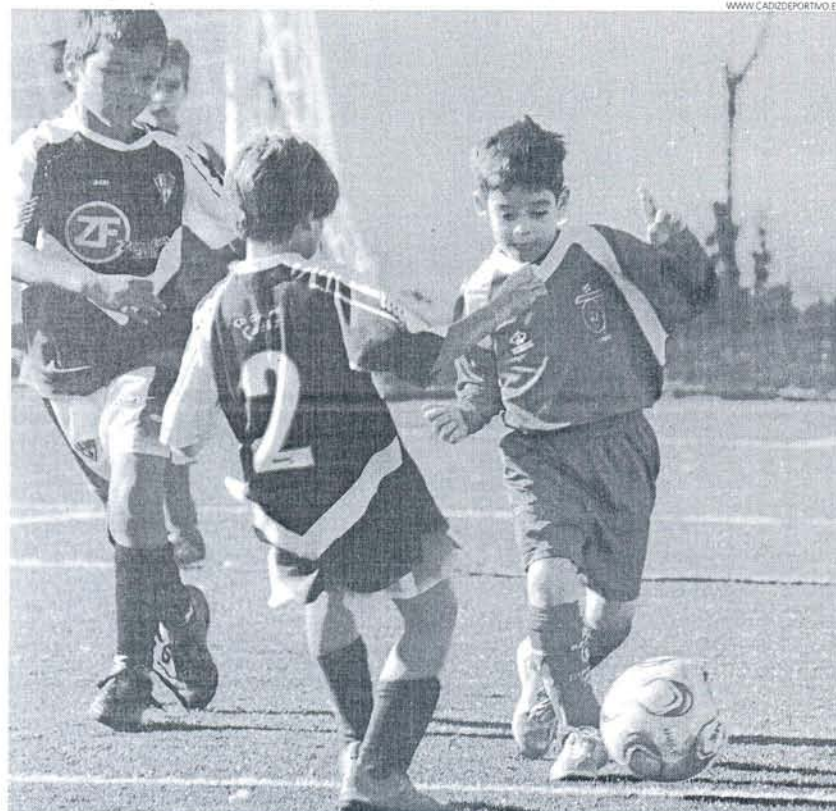
El líder del Grupo 1 de Primera Provincial Prebenjamín, el CD Olímpico, venció 4-1 al Domingo Savio.