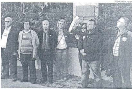
Los participantes en el acto de homenaje a los seis fallecidos en la A-7.