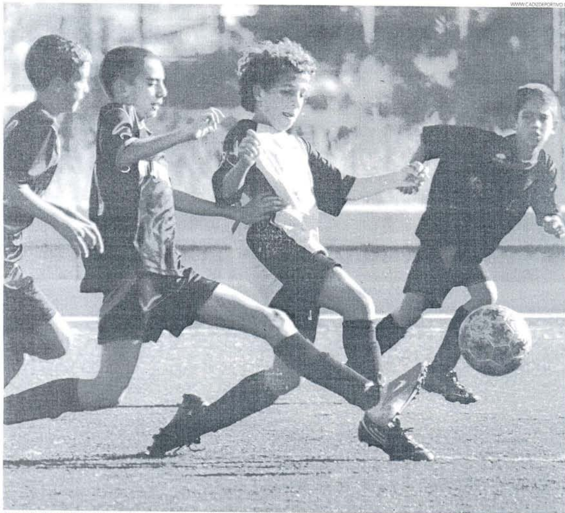
La Puertorrealeña, líder del Grupo 1 de Segunda Provincial Alevín, doblegó este fin de semana por 1-6 al Raúl Navas en las instalaciones de Elcano.

— Prebenjamines — Olimpico, Águila, Sanluqueño y Rota B mandan en sus grupos