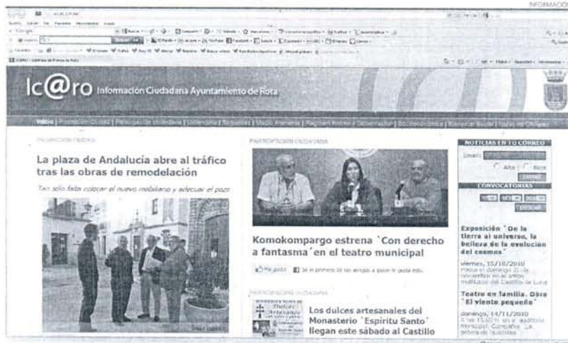
A través del portal pueden seguirse todas las novedades que se producen desde el Ayuntamiento de Rota.

El nuevo portal ofrece entre otros servicios el de RSS, que permite que los vecinos que quieran