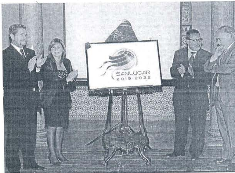
Un instante de la presentación pública del logotipo de la conmemoración, celebrada en el Palacio Municipal.

Las jornadas de apertura serán, concretamente, el 25 de noviembre, el 20 y el 27 de enero y el 3 de febrero. En esta convocatoria suman menos días que en ocasiones anteriores porque "se están desarrollando otro tipo de actividades para los alumnos". El teléfono para las reservas es 956 386601.