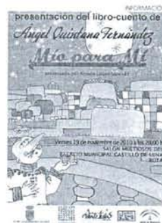
Cartel de la cita literaria.