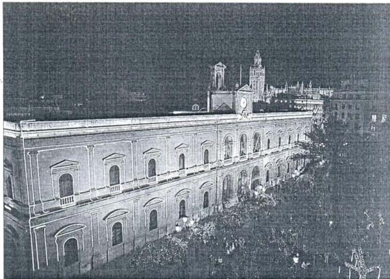
Imagen de archivo de la iluminación navideña del Ayuntamiento de Sevilla.

En estos dos asuntos hay una tensión por las competencias. Y,