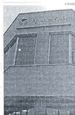
Quiéren que se facture por persona.

procedimientos para la aprobación de las tarifas, que deben incluir el trámite de audiencia de las asociaciones de consumidores, las indemnizaciones a percibir si se producen cortes del suministro por motivos que no respondan a fuerza mayor o acciones de terceros, la periodicidad de lectura de los contadores y facturación, las condiciones de presión y caudal mínimas exigibles por los usuarios, los procedimientos y requisitos para las bajas en el servi-