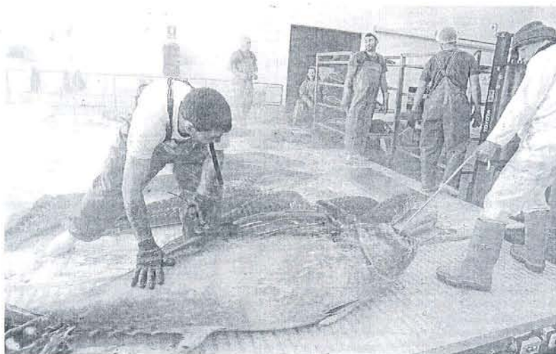
Ronqueo de atunes en Barbate.