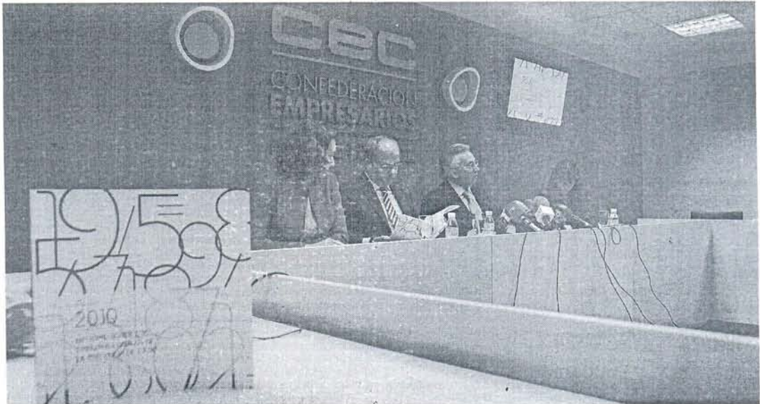
La Confederación de Empresarios presentó ayer el último informe sobre los Tributos Locales.

En el Impuesto sobre Vehículos de Tracción Mecánica-Turismos, Cádiz se sitúa en sexta posición a nivel provincial y en se-